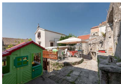
VRT SA GRILOM o