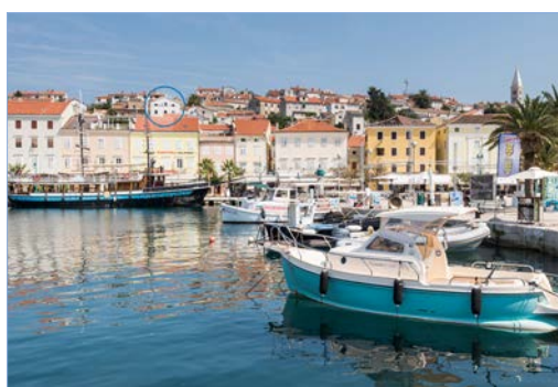
Vila MIRAKUL ***