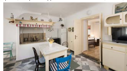
CAPTAIN'S APP ***

VRT SA GRILOM o • vrt z žarom • grill garden • giardino con ferri • der Grillgarten