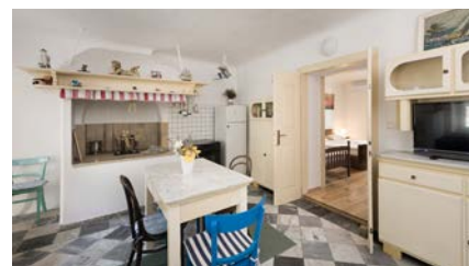
CAPTAIN'S APP ***

KONOBA o - više namjenski prostor • već namenski prostor • More purpose room • spazio per piu intenzioni • der mehrzweckgerät Raum VRT SA GRILOM o • vrt z žarom • grill garden • giardino con ferri • der Grillgarten